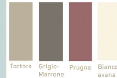
Tortora Grigio-Marrone Prugna Bianco avana