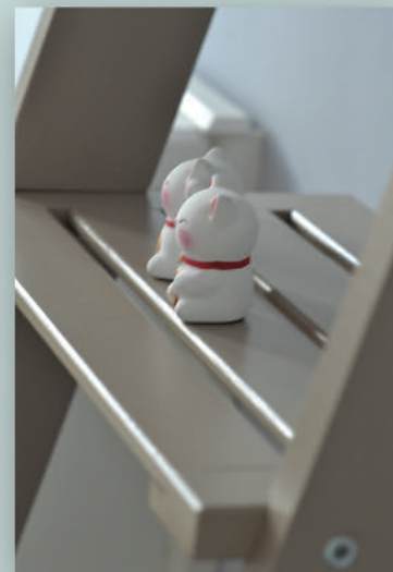
n.4 ripiani di profondità variabile cm 12,20,27,34