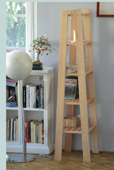
n.5 ripiani profondità variabile cm 20,24,27,30,34.