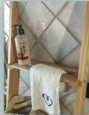
Art.229 Scaffale Larice naturale cm 39x156 p.39