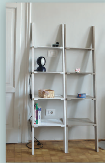
Art.229.04 Scaffale Larice colore bianco cm 39x156 p.39